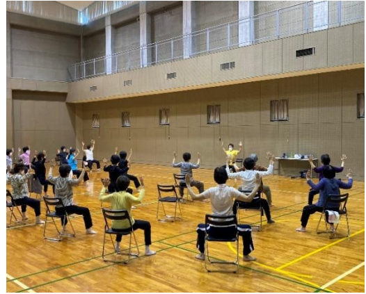
(イ) ストレッチ教室