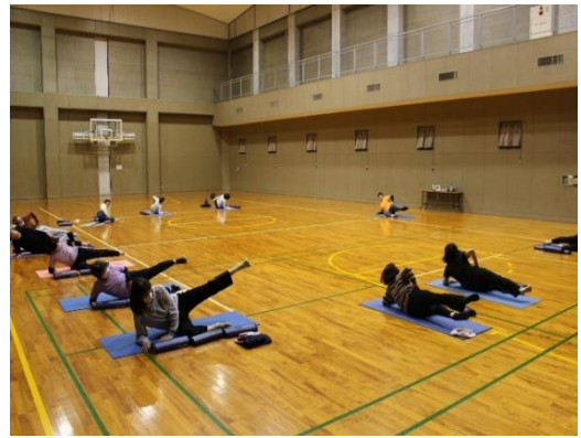
(ウ) ヨガ教室 (外部講師)